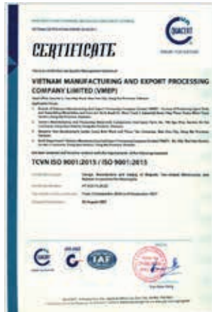
ISO9001品質管理體系認證證書

本集團高度重視產品品質，已建立並持續完善品質管理「品管」體系，實行標準化品管程式，在包括進料、生產過程、生產完成出車前等每個環節落實品質管控，通過質量計劃、質量控制、質量改進和質量保證四個環節的協同作用，實現「專注本業、品質第一、顧客滿意」最高指導原則。我們已取得ISO9001品質管理體系認證並通過歐盟COP生產一致性檢查。