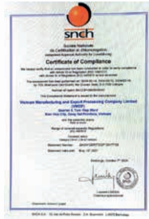
歐盟COP生產一致性檢查證書