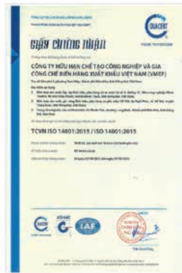
ISO14001環境管理體系認證證書

本集團嚴格遵守《環境保護法》等相關法律法規，依循ISO14001環境管理體系要求，建置完善的環境管理制度並通過驗證，在日常營運中確實監督與量測、執行內部稽核並提出矯正及預防措施、並持續改善。